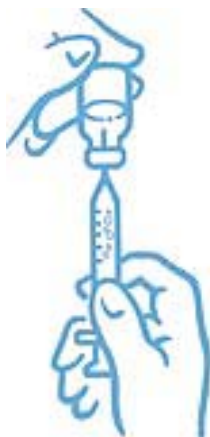
Obrázek 6: Odstraňte bubliny a doplňte správnou dávku