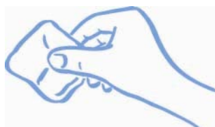
Přitiskněte gázu nebo tampon (netřete)