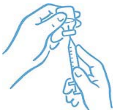
Obrázek 4: Hrot v tekutině