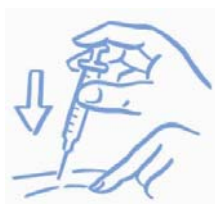
Obrázek A: Zlehka stiskněte kůži a aplikujte podle návodu