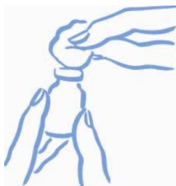
Obrázek 1: Otřete zátku alkoholem