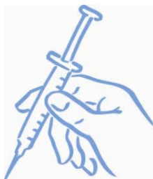
Obrázek 7: Připraveno k aplikaci