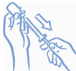
Obrázek 5: Natáhněte správnou dávku